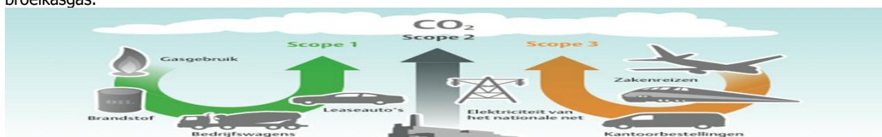
Afbeelding 1: CO 2 -scopes

In onderstaande afbeelding 1 ziet u de scopes die het GHG-Protocol onderscheidt op basis van de herkomst van het broeikasgas.